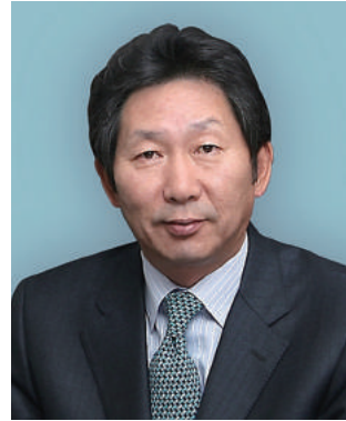
단국대학교 총장 장 호 성